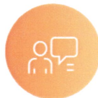
2차 임원 면접 (인성)