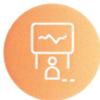
1차 면접 (직무)