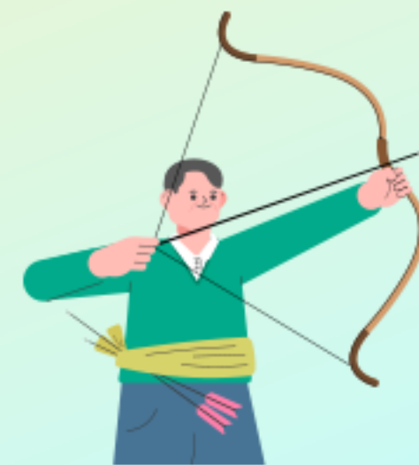
국궁 활쏘기 체험