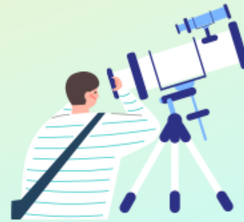
별자리 보기 체험