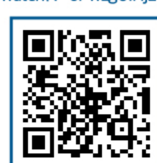
① 채용 담당자와 채팅하는 타임