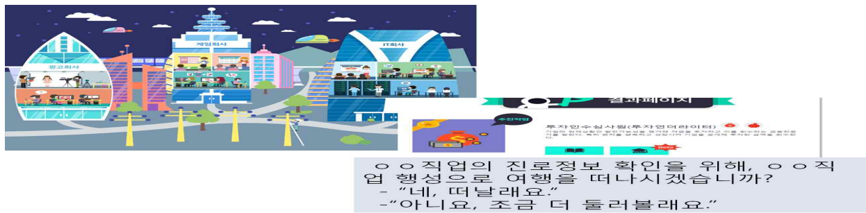
【온라인 진로탐색】 결과에 나타난 직업에 대한 상세정보 게임 등으로 알아보기