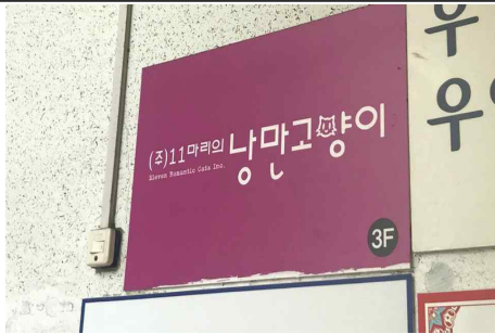
<대구-체험처> 11마리의 낭만고양이