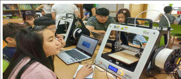
크리에이티브 팩토리 3D프린터 체험